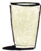
अजय के घर का गिलास